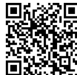
ANDRÉ LIMA Vereador - REDE SUSTENTABILIDADE